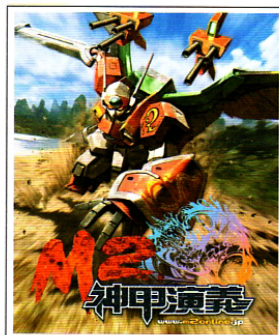
Copyright (C) 2004-2006 GaiaX Co.Ltd. All rights Reserved. Supported by NTT Communications. Copyright (C) 2002-2006 InterServ International Inc. All rights Reserved.